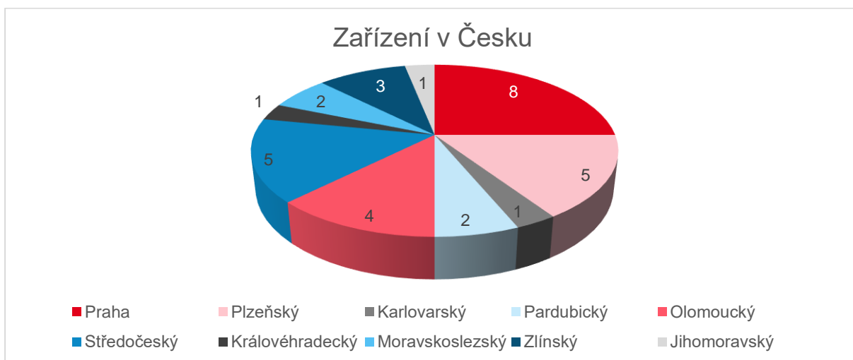
Obr. 3: Zapojení zařízení v rámci krajů v Česku

Ve sledovaném školním roce pocházela většina vysílajících zařízení z hlavního města Praha (8), následovala zařízení z Plzeňského a Olomouckého kraje.