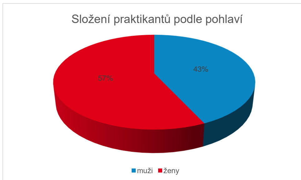
Obr. 4: Složení praktikantů podle pohlaví

Jak vyplývá z obr. 4, z celkového počtu 225 mladých lidí (129 z Česka a 96 z Německa) bylo mezi praktikanty 128 žen (cca 57%) a 97 mužů (cca 43%).